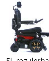
El. regulerbar benstøtte med glidefunksjon