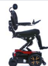
Seteløft 30 cm