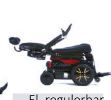
El. regulerbar rygg med glidefunksjon