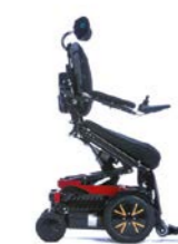
Aktiv tilt 15°